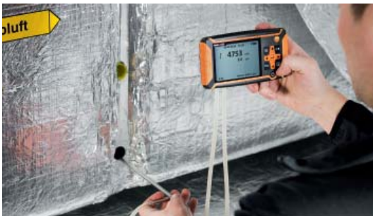
Misura con tubo di Pitot in un condotto