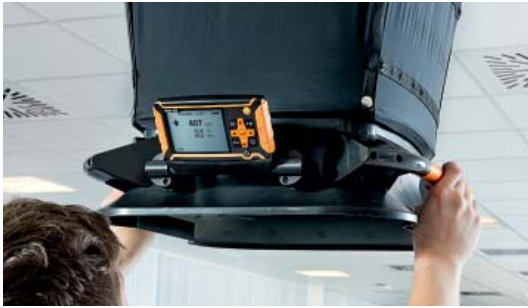
Peso leggero e display inclinabile.